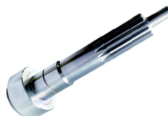
ドライブピニオン