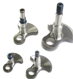
クランクシャフト